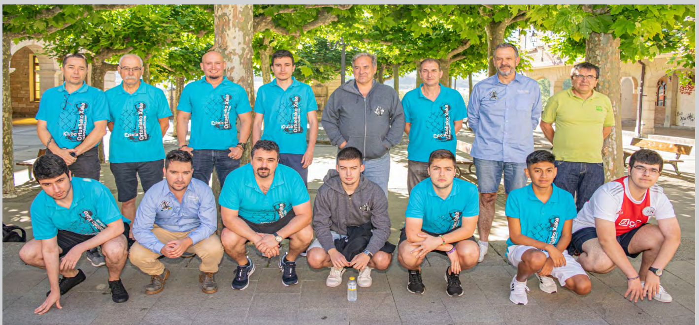
Foto de grupo de los peones participantes este día