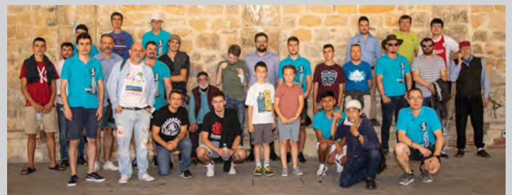
Imagen de grupo de algunos de los participantes del torneo,