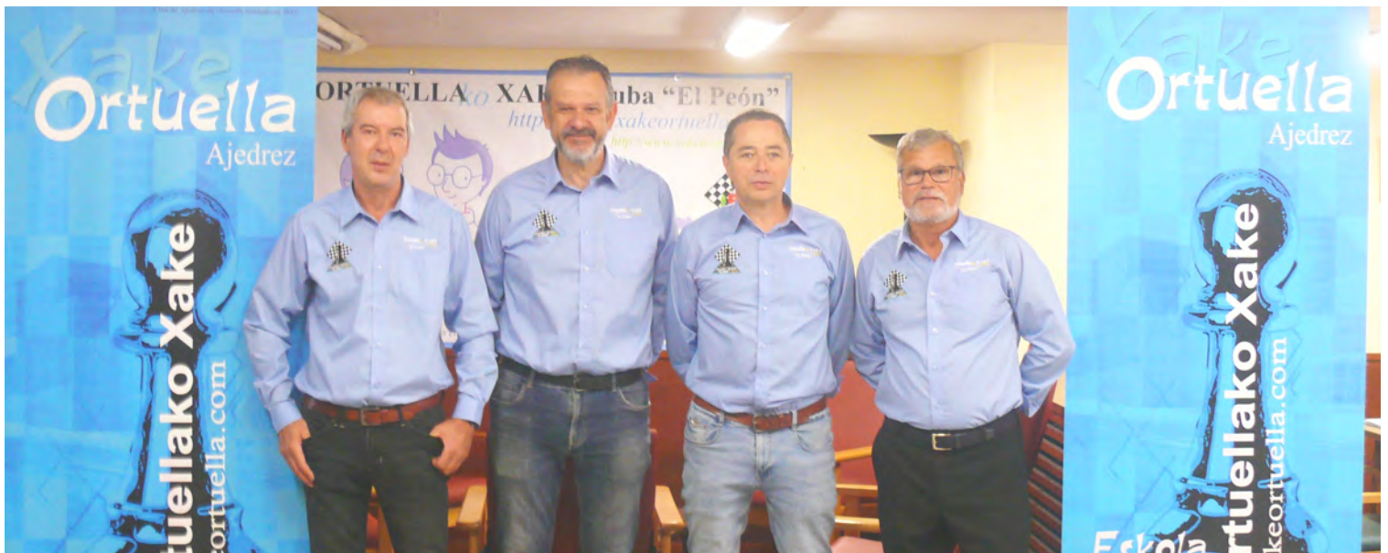
En el reportaje de fotos los cuatro modelos del club que se brindaron a ser retratados con el nuevo uniforme.