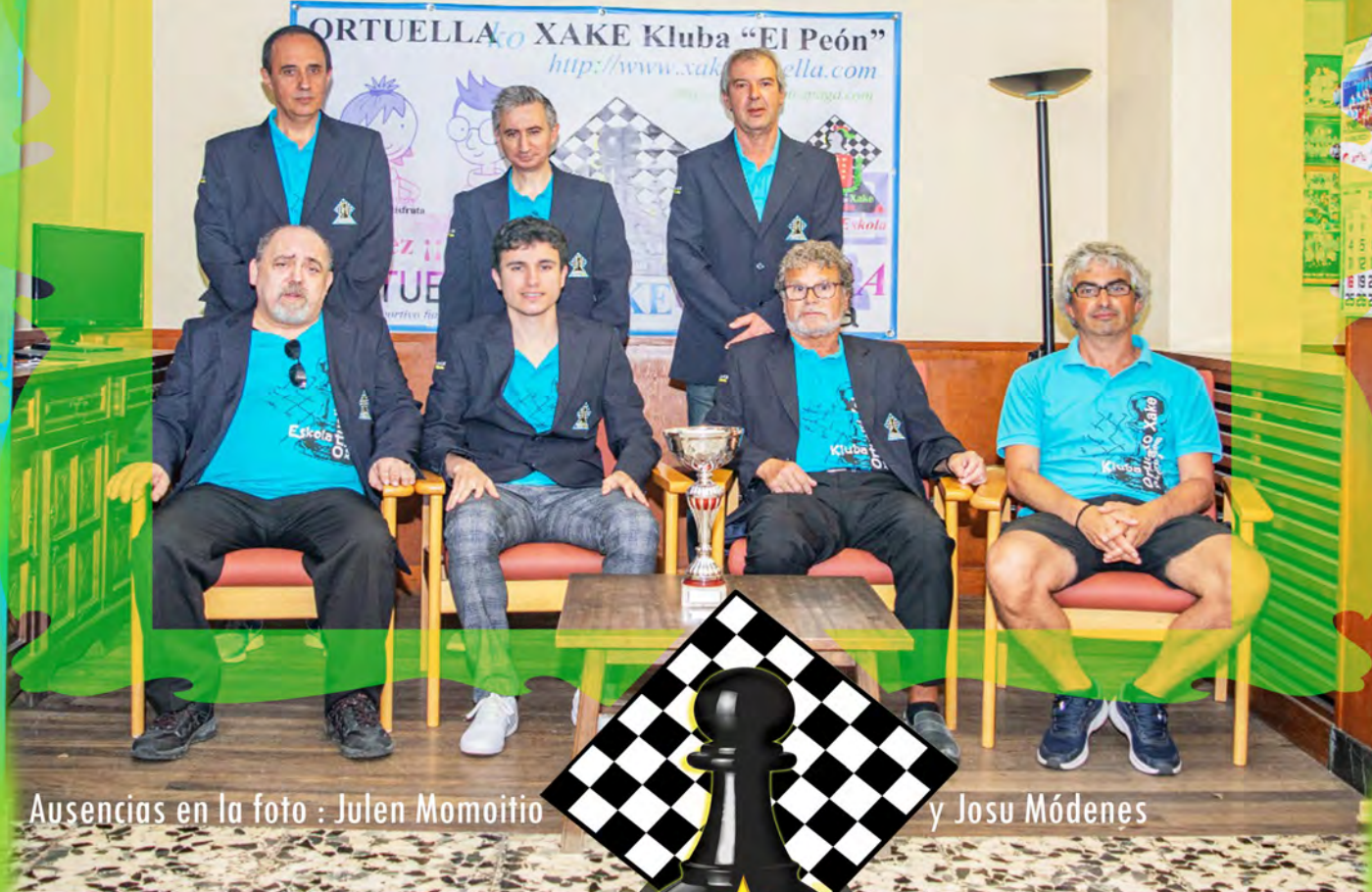
Ausencias en la foto : Julen Momoitio